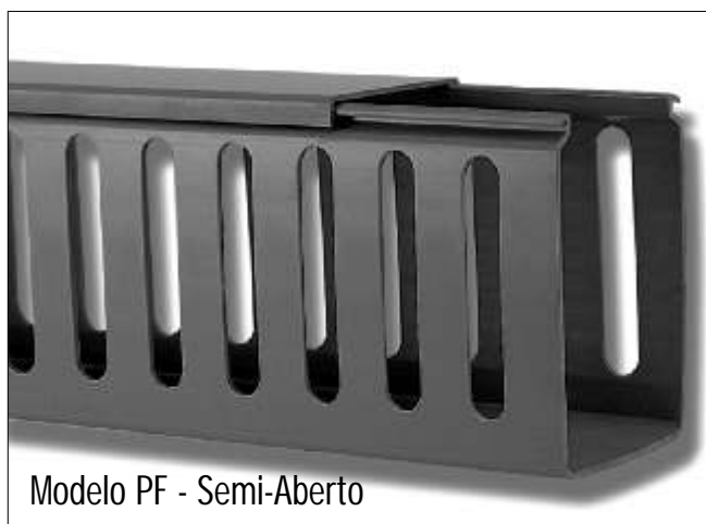
Modelo PF - Semi-Aberto