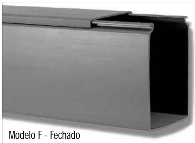
Modelo F - Fechado