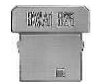
⑤ Plaqueta separadora