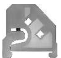
⑦ Placa final