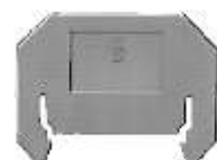
④ Placa intermediária