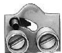
⑥ Cursor de ligação