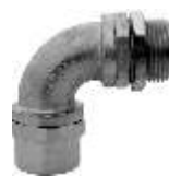
CMFC-900 Conector macho fixo curvo 90°